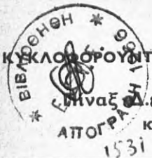
Πίναξ Δ.8: Διάκριση των τεθέντων αυτοκινήτων οχημάτων το πρώτον εις κυκλοφορίαν κατά το Β' εξάμηνον 1963, ως πρὸς τὸ ἐργοστάσιον κατασκευῆς (συνέχεια)