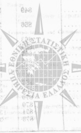
Table 3. Statement of Postal Savings Bank (in million drachmas)