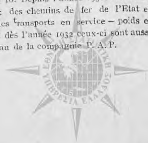
Tableau 8 et 10. Depuis l'année 1930, sont compris aux réseaux des chemins de fer de l'Etat et des Orientaux les transports en service— poids et tonnes-km.— et dès l'année 1932 ceux-ci sont aussi compris au réseau de la compagnie P. A. P.

Tableau 1—11. Réseau de l'Etat: Les données du réseau des chemins de fer de l'Etat comprennent aussi les données de la ligne étroite dès l'année 1930. Réseau des chemins de fer Orientaux-Section Grecque: Avant l'année 1928 les renseignements statistiques font défaut.